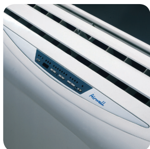
SXE 9-12 DCI