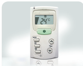
Eenvoudige wandthermostaat RCL