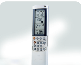
Infrarood afstandsbediening RC8W