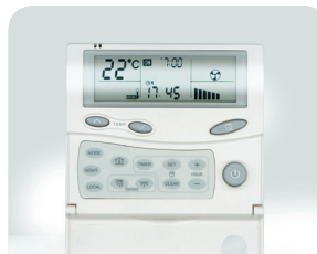
Geavanceerde wandthermostaat RCW 2