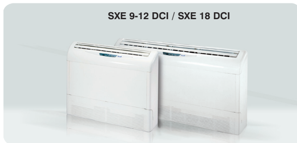
SXE 9-12 DCI / SXE 18 DCI