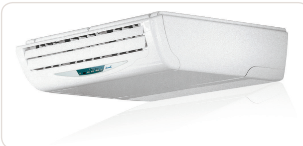
GC 12-18 DCI