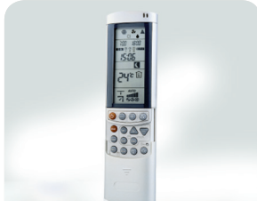
Infrarood afstandsbediening RC8W